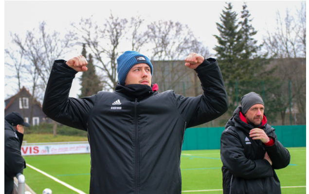
Mit breiter Brust in die Rückserie - unsere Zweite.