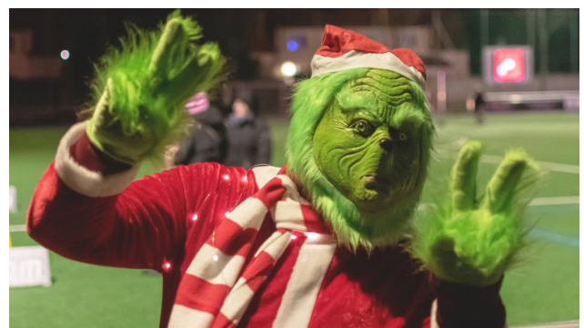
Der Grinch in Weihnachtsstimmung.

Das Highlight war ohne Zweifel das "a cappella ensemble gospelstreet". Neben weihnachtlicher Musik rundeten diverse Stände den Abend ab. Von Burger und Bratwurst, über Glühwein bis Cake-Pops wurde für jeden etwas geboten. Natürlich statteten auch Weihnachtsmann und Grinch unserer Eintracht und Gästen einen Besuch ab. Ein Event, welches in diesem Jahr sicher eine Wiederholung finden wird.