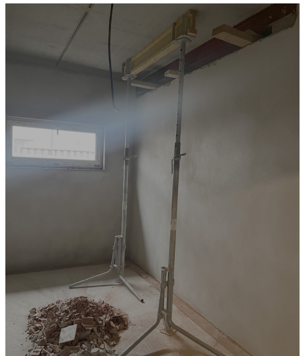
Zusätzlicher Durchbruch im EG - Trainerraum.

In unserem Fall müssen geringfügige Änderungen am Grundriss vorgenommen werden, welche ohne Zweifel dennoch mit einem großen Aufwand verbunden sind. Noch dazu, dass nahezu keinerlei zusätzliche Kosten entstehen dürfen.