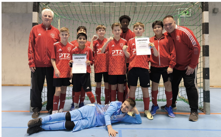
D-Junioren - Teamfoto zum Abschluss der HSM

Auch ein Großteil unserer Nachwuchsmannschaften trat dieses Jahr bei den Hallenstadtmeisterschaften an. Einen achtbaren vierten Rang erreichte dabei unsere D1. Kurios: im gesamten Turnier blieb man ungeschlagen. In der Gruppenphase gelangen ein Sieg und zwei Remis. Die jeweils Gruppen Ersten spielten anschließend um den Turniersieg. Als Zweitplatzierte trafen unsere jungen Teufel in ihrer Platzierungsgruppe auf Hellerau und Soccer for Kids. Beide Spiele konnten gewonnen werden, was am Ende den Sieg in dieser Gruppe und Rang vier insgesamt bedeutete.